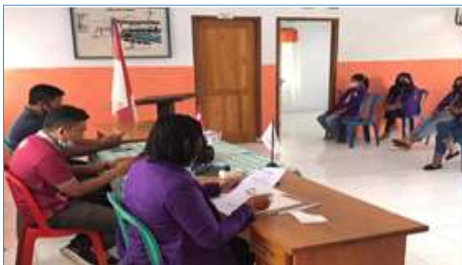
Gambar1. Penyampaian Materi Pemerintahan Desa

oleh sekretaris desa dan perangkat desa. Perangkat desa terdiri atas kepala-kepala urusan, yaitu pelaksana urusan dan kepala dusun. Kepala dusun adalah wakil kepala desa di wilayahnya. Kepala-kepala urusan membantu sekretaris desa menyediakan data informasi dan memberikan pelayanan bagi masyarakat desa. Selanjutnya pelaksanaan urusan dilakukan oleh pejabat yang melaksanakan urusan rumah tangga desa di lapangan. Urusan rumah tangga desa adalah urusan yang berhak diatur dan diurus oleh pemerintah desa. Karena itu, untuk mengatur, mengurus, dan pengurusan urusannya, maka pemerintah desa membuat peraturan desa. Peraturan desa dibuat oleh kepala desa bersama dengan Badan Permusyawaratan Desa yang selanjutnya disingkat dengan BPD. Peraturan desa dilaksanakan oleh kepala desa dan dipertanggung jawabkan kepada rakyat atau masyarakat desa melalui BPD. (Sugiman, 2018).