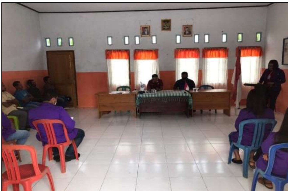
Gambar 2: Suasana Kegiatan Penyuluhan

menerapkan pola asuh yang baik juga. Contoh-contoh yang diberikan dalam pola asuh orang tua seperti dengan cara menerapkan nilai dan norma agama dan kehidupan kepada anak dengan penuh perhatian dan juga kasih sayang.