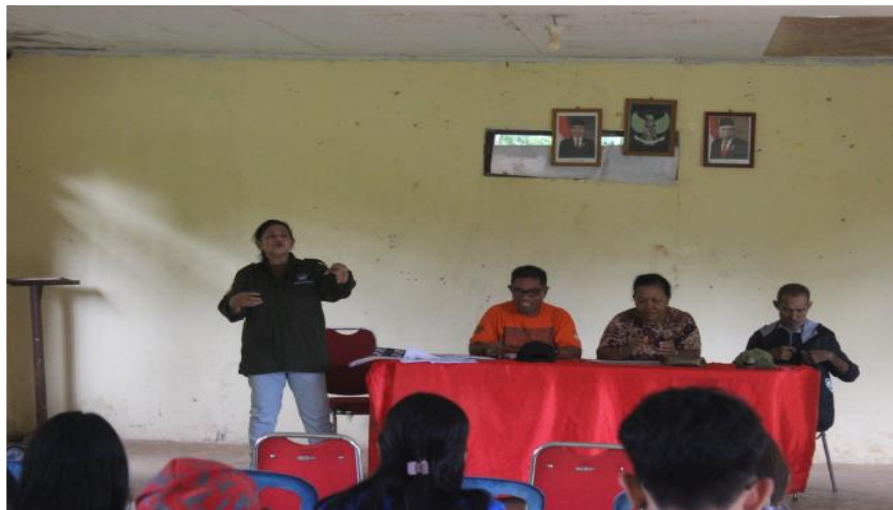
Gambar 5. Penyampaian Materi Penyuluhan

menyampaikan masalah-masalah yang dihadapi dalam usaha budidaya tanaman jagung. Diskusi yang terjadi antara narasumber dan peserta yang mengikuti penyuluhan sangat menarik. Mereka menyampaikan masalah-masalah yang dihadapi dalam usaha budidaya tanaman jagung. Tim PkM/narasumber memberikan jawaban yang mudah dipahami oleh setiap peserta, sehingga peserta sangat antusias dalam mengikuti penyuluhan tersebut. Aktivitas kegiatan penyuluhan dalam bentuk gambar sebagai berikut :