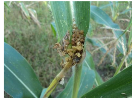
Gambar 1. Gejala Serangan Hama Penggerek Batang Jagung

Gejala serangan yang ditimbulkan oleh Ostrinia furnacalis yaitu batang lemah dan mudah patah akibat tiupan angin serta ulat membuat gerkakan dalam batang dan terowongan di dalamnya (Pangumpia dkk., 2019). Jika tanaman tidak patah, jagung menjadi kecil dan biji yang terbentuk hanya sedikit.