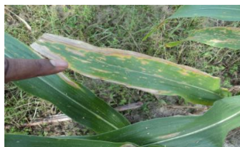
Gambar 4. Gejala Penyakit Hawar Daun

Penyebab utama dari penyakit tersebut adalah terdapat bercak kecil, jorong, berwarna hijau tua/kelabu kebasah-basahan (Ramadona dkk., 2023). Bercak berubah menjadi coklat hijau. Bercak kecil menyatu membentuk bercak besar.