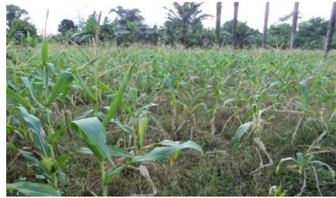
Gambar 3. Gejala Penyakit Bulai

Penyebab penyakit tersebut ialah seluruh bagian daun terserang, pada daun muda terdapat bercak-bercak coklat kecil. Bercak berkembang menjadi jalur sejajar dengan tulang daun dan bergaris-garis (Sulfitri dkk., 2024). Tanaman muda yang terserang biasanya tidak menghasilkan buah. Pada tanaman tua, buah yang dihasilkan kelobot terbuka dan biji sedikit.