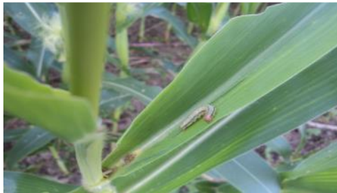
Gambar 2. Gejala Serangan Hama Penggerek Tongkol Batang Jagung

Gejala serangan ditunjukkan melalui ulat memakan biji didalam tongkol dan bersifat kanibal (saling memakan), sehingga hanya satu larva tiap tongkol (Czepak dkk., (2013) dalam Meytiana dkk., (2017)). Serangan pada tongkol muda terjadi kerusakan berat, sedangkan tongkol agak tua hanya kerusakan biji-biji pada ujung tongkol.