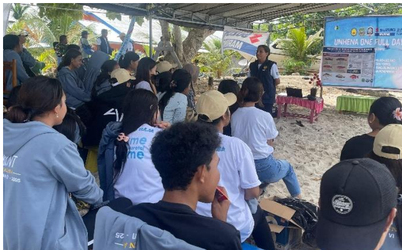
Gambar 2. Kegiatan Penyuluhan Kepada Masyarakat Desa Saminyamau