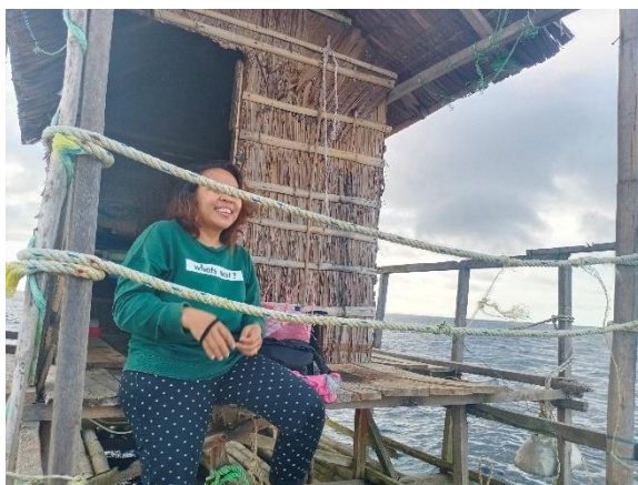
a. Rumpon permukaan