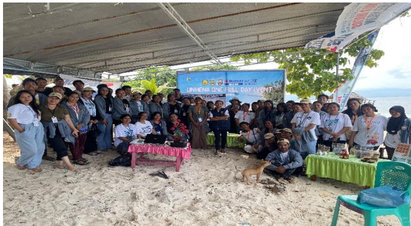
Gambar 4. Dokumentasi Pemateri dan Peserta Penyuluhan