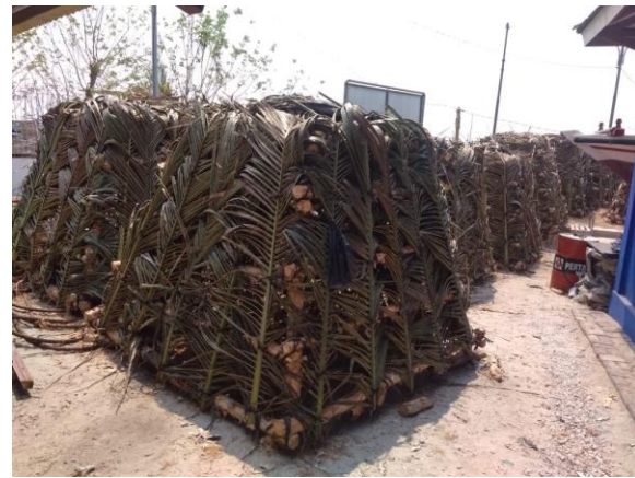
b. Rumpon dasar