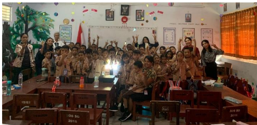
Gambar 8. Foto Bersama Pemateri dan Peserta Kegiatan

konten tentang laut, memiliki sikap yang baik terhadap lingkungan laut dan tidak melanggar nilai-nilai kelautan, serta berperilaku baik terhadap lingkungan laut (Cava dkk., 2005 & Strang dkk., 2007 dalam Hindrasti & Irawan, 2018).