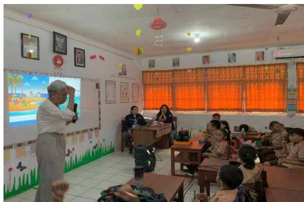
Gambar 3. Presentasi Materi

seperti ikan, penyu, dan burung-burung dikarenakan salah konsumsi atau karena kena jeratan, yang kesemuanya ini dapat menyebabkan pendarahan internal, bisul, penyumbatan saluran pernafasan dan pencernaan bahkan kematian bagi biota laut (Muti'ah dkk. , 2019).