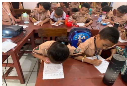
Gambar 4. Kegiatan Pengerjaan Tugas

Secara lengkap substansi materi yang diberikan selama kegiatan PkM berlangsung disajikan dalam bentuk PowerPoint . Materi dibawakan secara sederhana sehingga lebih mudah dimengerti oleh siswa sekolah dasar. Setelah pemberian materi melalui media presentasi kemudian dilanjutkan dengan kegiatan interaktif yang diberikan berupa tugas menghubungkan gambar dan menentukan kegiatan yang menjaga maupun merusak ekosistem laut berdasarkan gambar (Gambar 4).