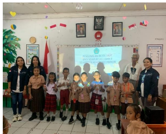
Gambar 6. Pemberian Hadiah Kepada Siswa

Para siswa yang menjawab dengan benar dan tepat akan diberikan hadiah dan juga salah satu hadiah terbaik diberikan kepada siswa yang mengerjakan kuis dengan rapi dan tepat (Gambar 6). Hadiah yang