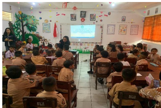
Gambar 7. Pemberian Snack Kepada Siswa

Literasi kelautan ( Ocean Literacy ) didefinisikan sebagai pengaruh laut terhadap anda dan pengaruh anda terhadap laut. Ada 7 prinsip dan 45 konsep dasar literasi kelautan. Seseorang yang memiliki literasi kelautan harus memiliki tiga aspek yaitu pengetahuan