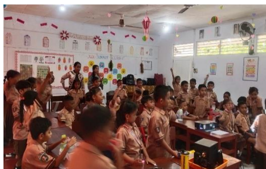
Gambar 5. Kegiatan Diskusi

Kegiatan diskusi ini menggunakan pendekatan cepat tangkas artinya butuh kecepatan dan ketepatan para siswa dalam menjawab. Dari hasil pengamatan saat mengajukan pertanyaan para siswa agak bingung dalam menjawab gambar tentang terumbu karang, karena ada yang menjawab karang maupun lainnya. Hasil pengamatan ini menggambarkan presentase kecil untuk pertanyaan pertama. Sedangkan berdasarkan pengamatan juga, presentase tertinggi untuk antusiasme menjawab pada pertanyaan terakhir yaitu tentang hewan laut lain selain pada slide kemudian dilanjutkan pada posisi kedua untuk jawaban cara menjaga laut.