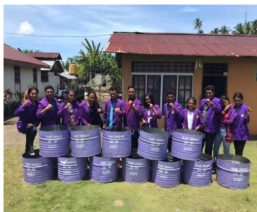
Gambar 4. Pembuatan dan Pembagian Tempat sampah