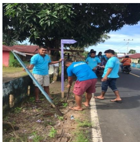
Gambar 3. Pembuatan dan Pemasangan Papan Nama Perangkat Desa