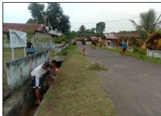
Gambar 2. Aksi Bersih Lingkungan Desa