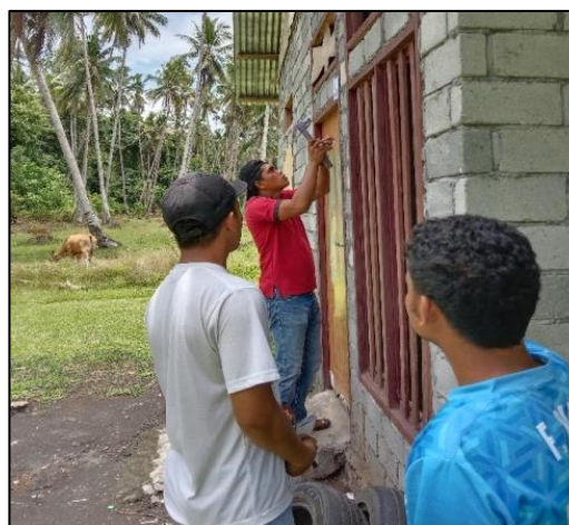
Gambar 5. Pemasangan Nomor Rumah Penduduk

sehingga program tersebut bisa dipahami dan diterima oleh masyarakat. Nomor rumah yang dipasang menggunakan seng plat aluminium dengan desain yang sederhana dan jelas, dicat berwarna ungu dan putih.